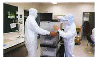
製品のオリコン入れ作業