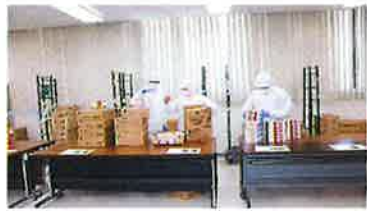
製品のピッキング作業