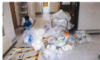
リサイクル分別作業