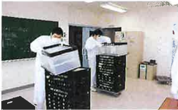
オリコン(折り畳みコンテナ)組み立て作業

※4 コースの選択は、入学後の訓練状況、障害特性、訓練生や保護者の希望を総合的に評価して決定します。