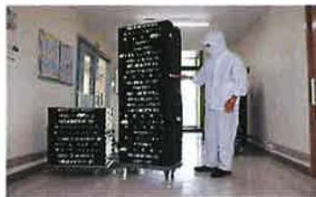
オリコン移動作業