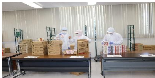
製品のピッキング作業