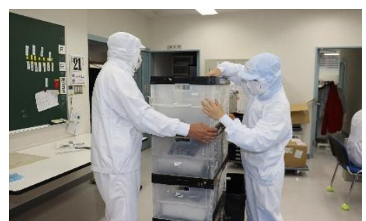
製品のオリコン入れ作業