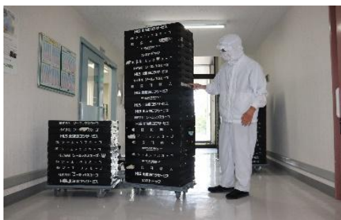
オリコン移動作業