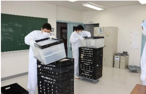
オリコン（折り畳みコンテナ）組み立て作業

※4 コースの選択は、入学後の訓練状況、障害特性、就職先 事業所の要望などを総合的に評価して決定します。