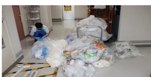
リサイクル分別作業